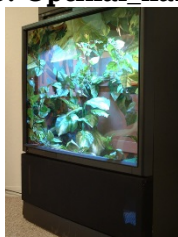
19. Projektoros tv