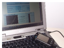
4. GPRS mobil modem