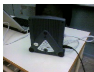
18. PLC adapter