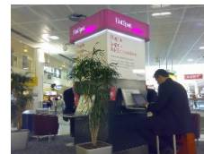
5. Hotspot helyszín