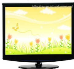
11. LCD tv