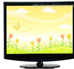
11. LCD tv