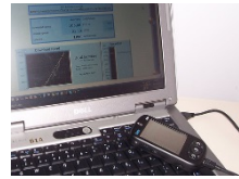
4. GPRS mobil modem