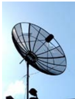
14. Műholdas internet