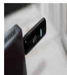
23. USB kulcs 3G