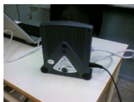
18. PLC adapter