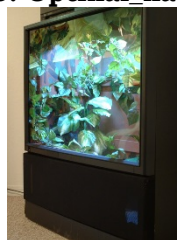
19. Projektoros tv