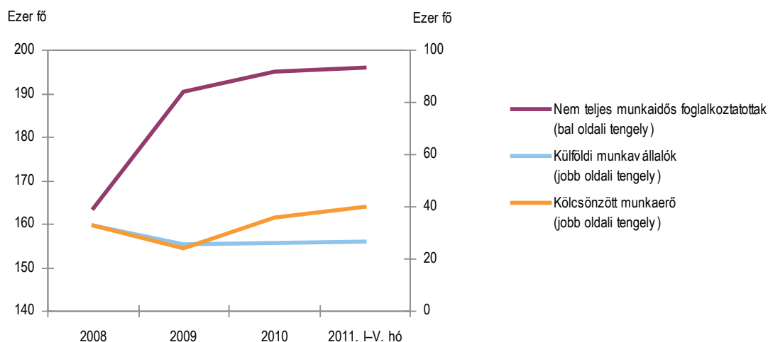
Az atipikus formában foglalkoztatottak létszámának alakulása

A kifejezetten konjunktúramutató forrásból kifejlesztett üresálláshely-statisztika 2009-ben a foglalkoztatási helyzet drámai rosszabbodását jelezte. A versenyszféra megfigyelt szegmensében az üres álláshelyek száma az előző évhez képest közel megfeleződött, a fizikai munkakörök esetében pedig az átlagosnál is nagyobb csökkenés volt. Az adatok egyértelműen jelzik, hogy a gazdálkodók – legalábbis átmenetileg – nem vettek fel új munkavállalókat a kiváltak helyére. A 2010. évi adatok már javulást jeleznek, de az üres álláshelyek száma a versenyszférában még jelentősen elmarad a 2008. évi átlagtól.