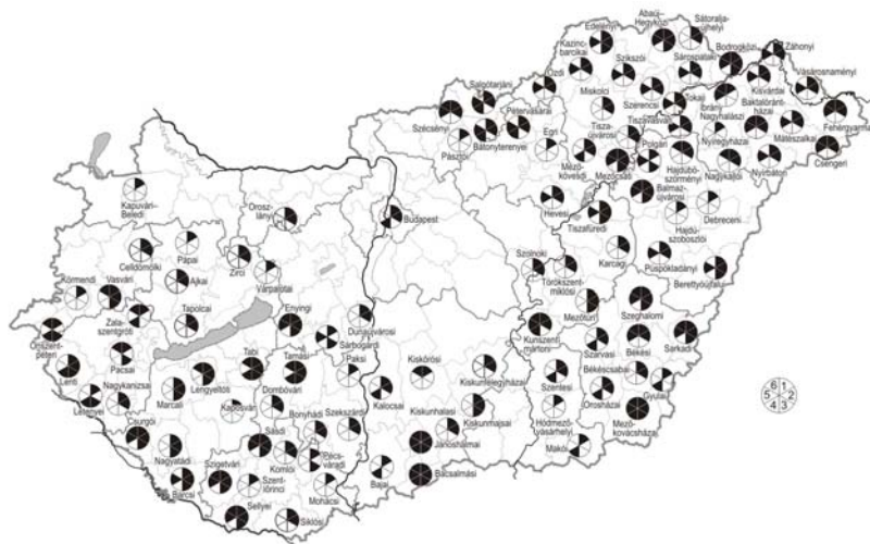
2. ábra A vándormozgalom térszerkezeti összefüggései

1 = migrációs veszteség (2000–2007); 2 = migrációs veszteség \geq 2,0\% ; 3 = népsűrűség < 50 fő/km 2 ; 4 = 60 évesnél idősebbek aránya \geq 23,0\% ; 5 = munkanélküliség \geq 13,8\% ; 6 = 1 főre jutó személyi jövedelemadó \leq 200 ezer forint.