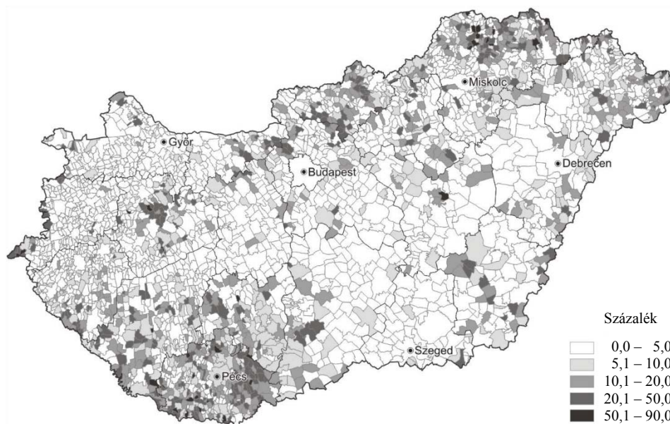
A két nemzetiségű deklarációk összlakosságán belüli aránya, 2011