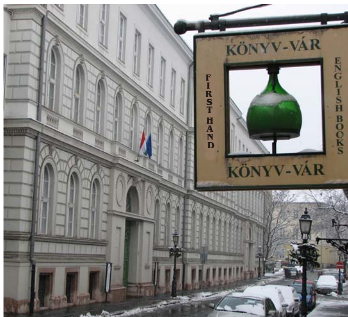
Akadémiai kutatóintézetek székháza a Várban Országház u. 30.