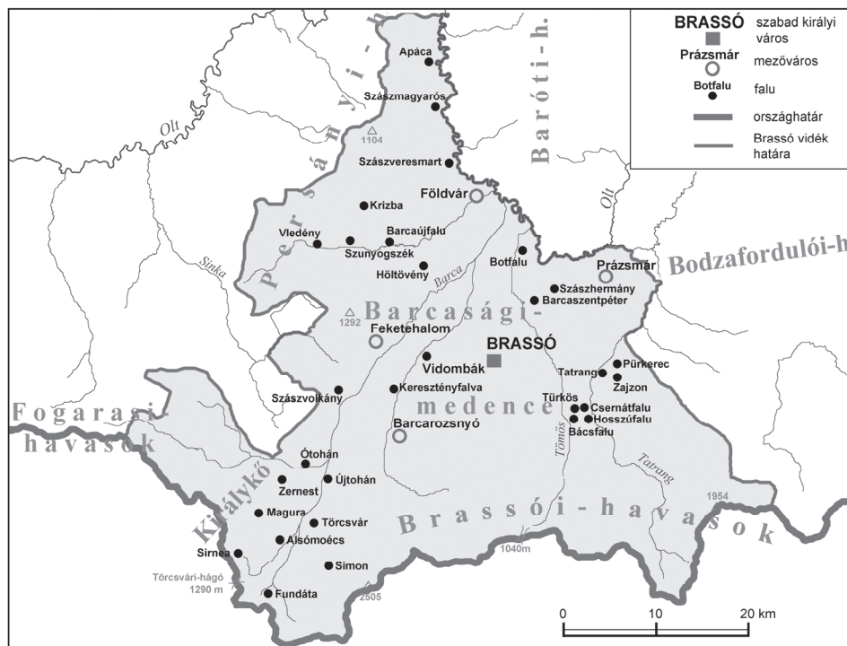
A Barcaság (Brassó vidéke) településhálózata, 1713 The settlement system of Burzenland (the region of Brassó/ Braşov) in 1713